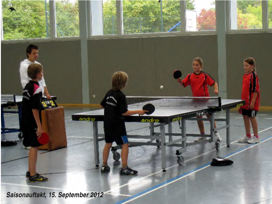
Saisonaufakt, 15. September 2012

Relegationsspielen von der 4. in die 3. Kreisliga auf, wo sie sich bis heute im oberen Drittel behauptet.