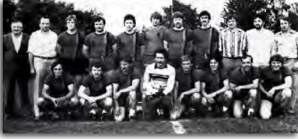
Die Meistermannschaft 1980

1. Handballmannschaft Bayerischer Meister auf dem Großfeld