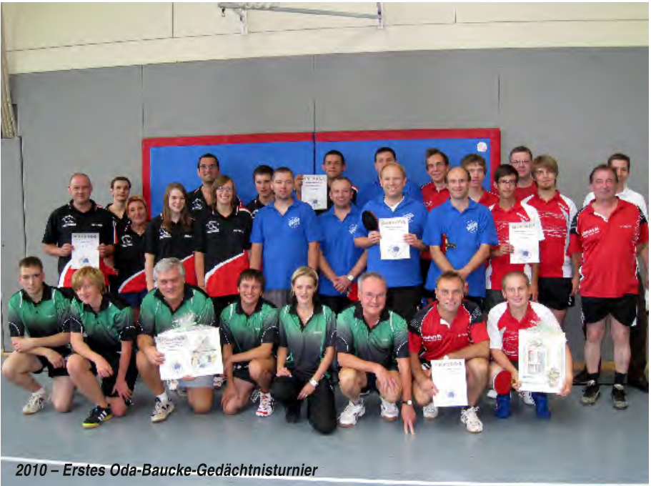
2010 – Erstes Oda-Baucke-Gedächtnisturnier