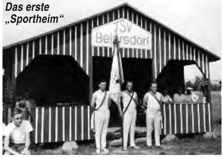
Das erste „Sportheim“

1953 bekam der Verein sein erstes „Sportheim“; eine kleine Hütte aus Holz zum Umkleiden ohne Wasseranschluss und Sanitäreinrichtungen.