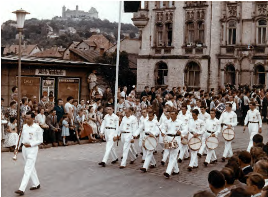
Der Spielmannszug 1956 beim Jubiläum 900 Jahre Coburg

Anfängliche Verwerfungen sind heute vergessen, und der Erfolg beider Vereine, des TSV Beiersdorf und des Musikvereins Beiersdorf, belegt eindrucksvoll die Berechtigung der entstandenen Konstellation.