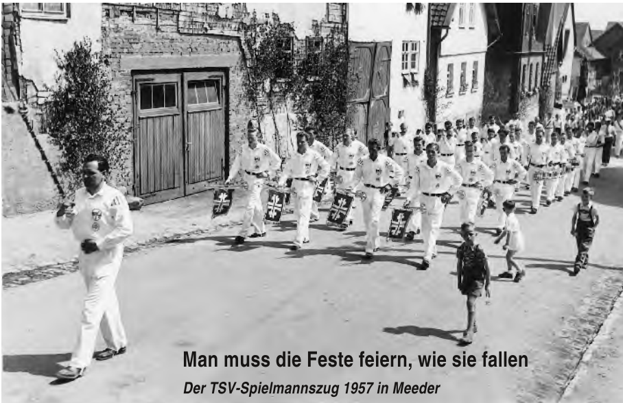
Man muss die Feste feiern, wie sie fallen Der TSV-Spielmannszug 1957 in Meeder

Zu Punkt 2 einigte man sich dahin, daß ein Festessen auf den gültigen Tag den 8. März der Gründung des Vereinsabgehalten werden soll, wozu auch die Mitglieder-Frauen eingeladen werden. Pro Mitglied sowie Frau und Löglinge sollen je 1 Sauerbraten sowie 4-5 Glas Bier erhalten.