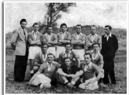
Die Mannschaft von 1948

Das 50. Jubiläum wurde 1963 in großem Rahmen und mit vielen sportlichen Begegnungen gefeiert.