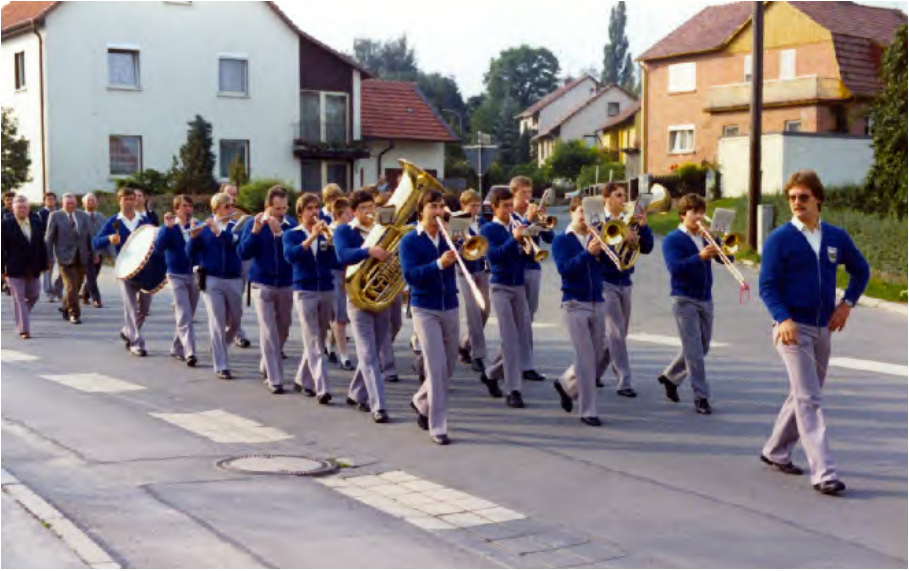
Folgen wir dem Spielmanszug des TSV Beiersdorf zu einer Reise durch die Vereinsgeschichte