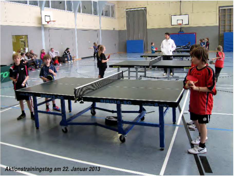
Aktionstrainingstag am 22. Januar 2013