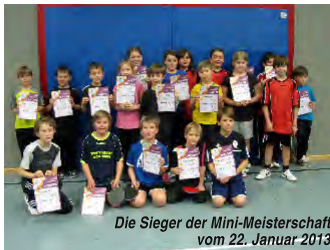
Die Sieger der Mini-Meisterschaft vom 22. Januar 2013

2009/2010 stieg die 1. TT-Herrenmannschaft nach