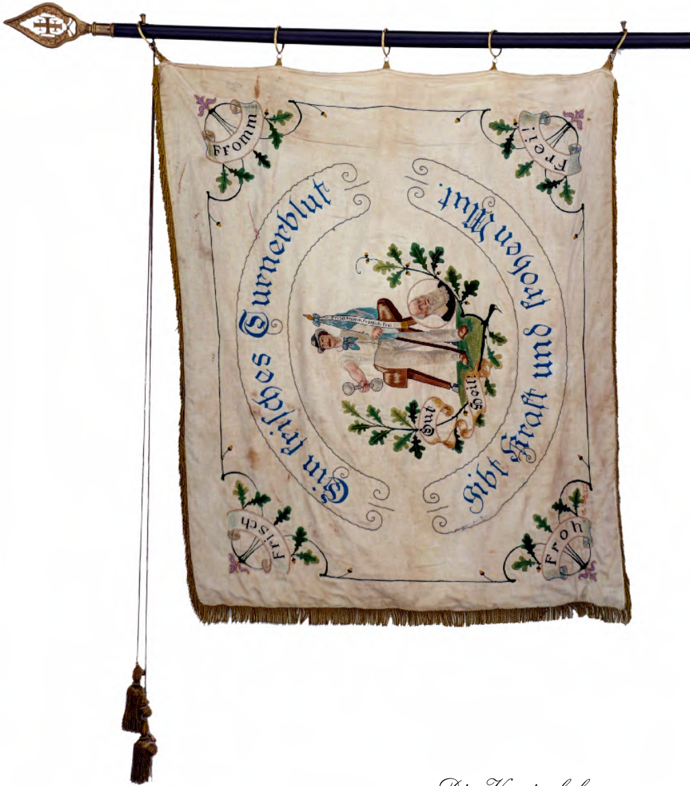
Die Vereinsfahne des TV Beiersdorf, gestiftet 1923 zum zehnjährigen Vereinsbestehen; rechts das heutige Vereinswappen und das neue Logo des TSV Beiersdorf