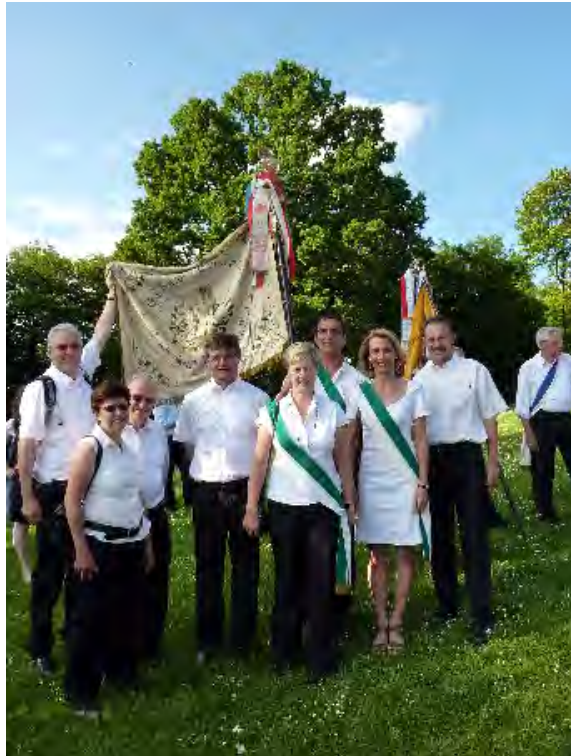
Die TSV-Abordnung zum Turnfest-Jubiläum in Coburg (2010)

11. Juni 2010 Eröffnungsfeierlichkeiten in Coburg zur 150. Wiederkehr des 1. Deutschen Turnfestes