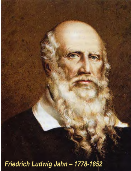
Friedrich Ludwig Jahn – 1778-1852

Nach der Vereinsgründung 1913 beschaffte der Vorstand des Turnvereins Beiersdorf sofort für 105 Mark einen Barren, eine Hantel, einen Stein und eine Kugel und ein Vierteljahr später ein Reck für 54 Mark an und bemühte sich um einen geeigneten Turnplatz, um Turnstunden abhalten zu können.