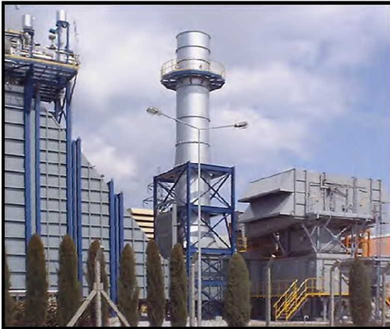
Bypass-System mit Diverter DBP in einer GUD-Anlage